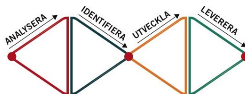
Design Thinking by H&H.

Hållbar kompetensförsörjning startar med att analysera och identifiera framtida behov för att sedan kartlägga vad som redan finns internt och vilken kompetens ni eventuellt behöver förstärka med framöver.